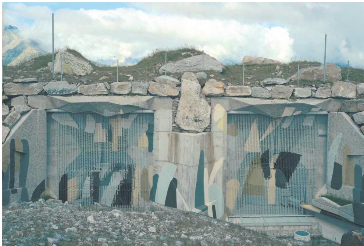
Die Festung Gütsch auf dem Gemeindegebiet von Andermatt im Kanton Uri war Teil des Reduits.

Die Prepper-Bewegung hat ihren Ursprung in den USA in der Zeit des Kalten Kriegs. Viele Menschen hatten damals Angst vor dem Atomkrieg. In den USA soll es inzwischen 23 Millionen Prepper geben. Spätestens 2012 mit der Fernsehserie «Doomsday Preppers» wird Preppen auch in Europa ein Massenphänomen, die Corona-Pandemie und die Angst vor der Erderwärmung